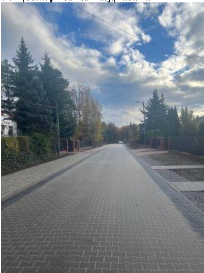
ul. Dębowa po realizacji zadania