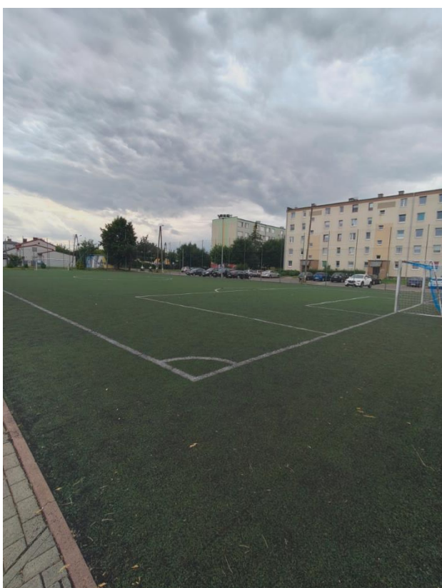
Boisko Orlik po realizacji zadania