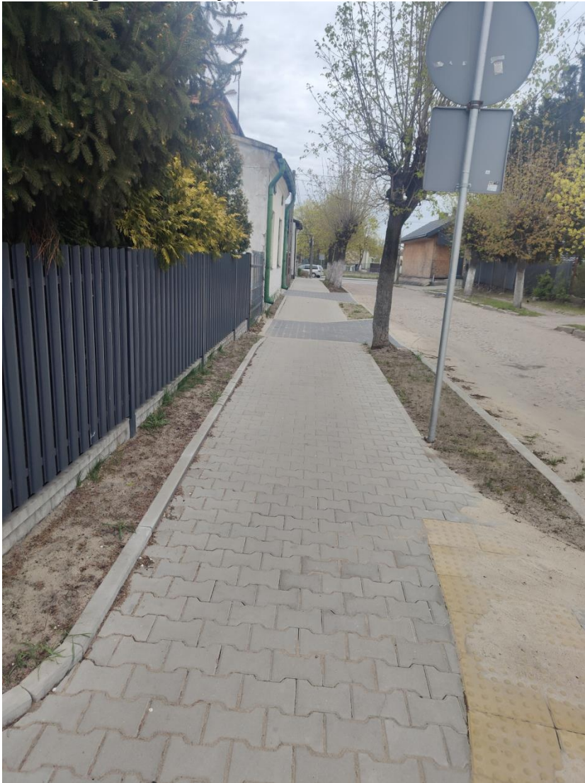
ul. Dolna po realizacji zadania