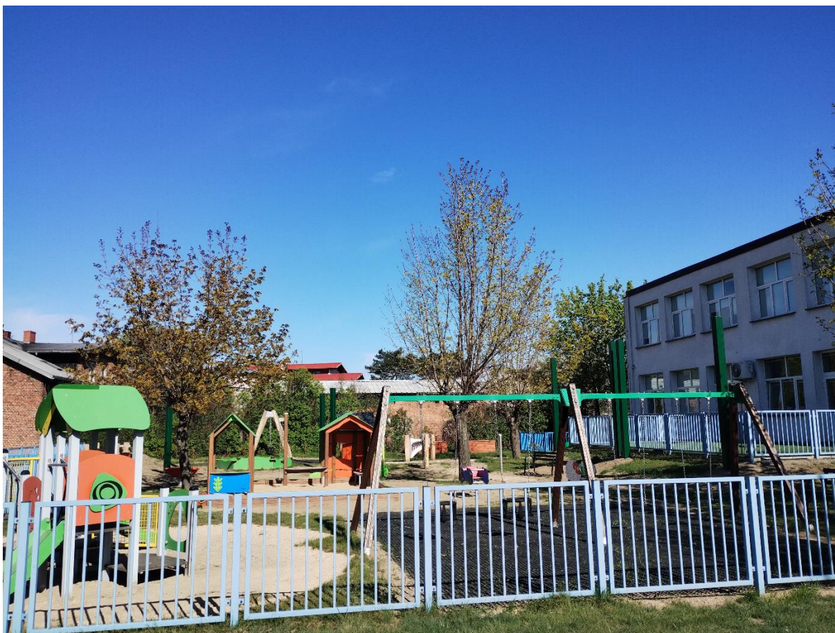
Plac zabaw po realizacji zadania