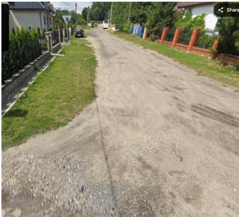
ul. Jana III Sobieskiego- przed realizacją zadania

Całkowity koszt realizacji inwestycji wyniósł 363 042,48 zł.