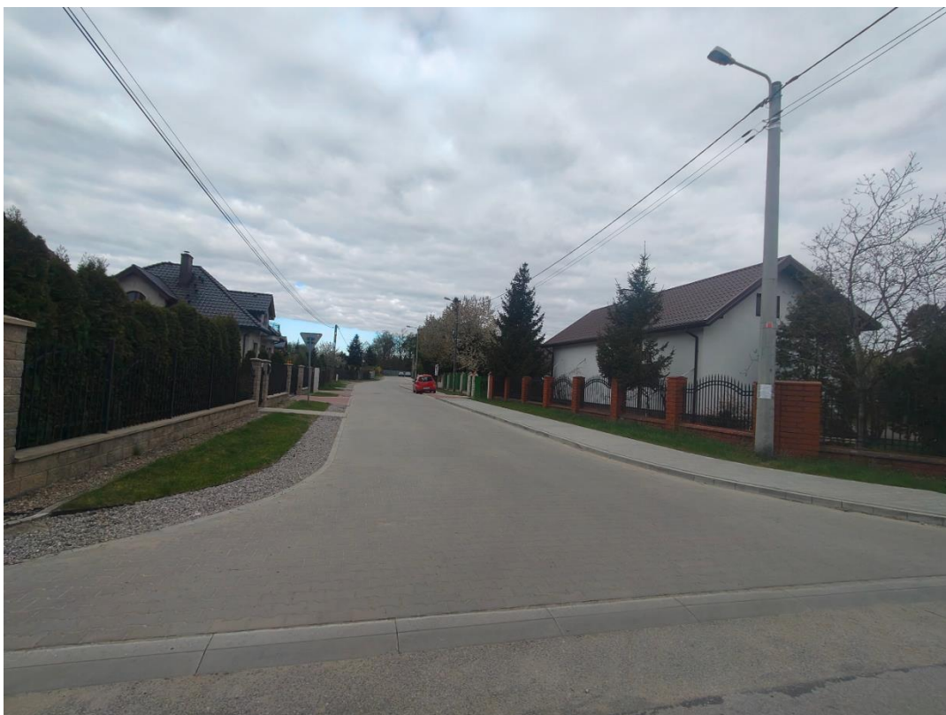
ul. Jana III Sobieskiego po realizacji zadania