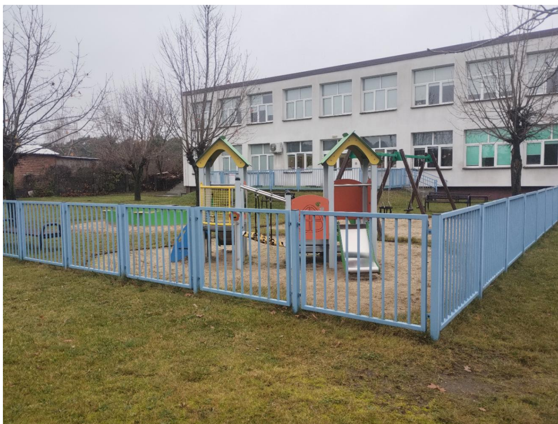
Plac zabaw przed realizacją zadania

Projektowo – Inwestycyjne „PAMAR” Krzysztof Hemka, na podstawie której firma CIVIL CONSTRUCTION Sp. z o.o. w terminie 2 miesięcy od dnia podpisania umowy tj. od 01.10.2025 r. wykonała roboty budowlane o wartość 306 477,55 zł. W ramach przedsięwzięcia przeprowadzona została również przez uprawnioną firmę: Prometeusz Cezary Krakowski kontrola pomontażowa potwierdzająca zgodność placu zabaw i nawierzchni z normami PN-EN 1176-1177. Roboty odebrano bez uwag w dniu 16.12.2025 r. Łączny koszt zadania w 2025 r. wraz z kosztem dokumentacji projektowej, kosztem tablic informacyjnych, certyfikatem zgodności oraz nadzorem inwestorskim wyniósł 329 945,95 zł z czego 296 589,27 zł dofinansowano ze środków Funduszu Pracy w ramach Resortowego programu „Aktywne Place Zabaw 2025”.