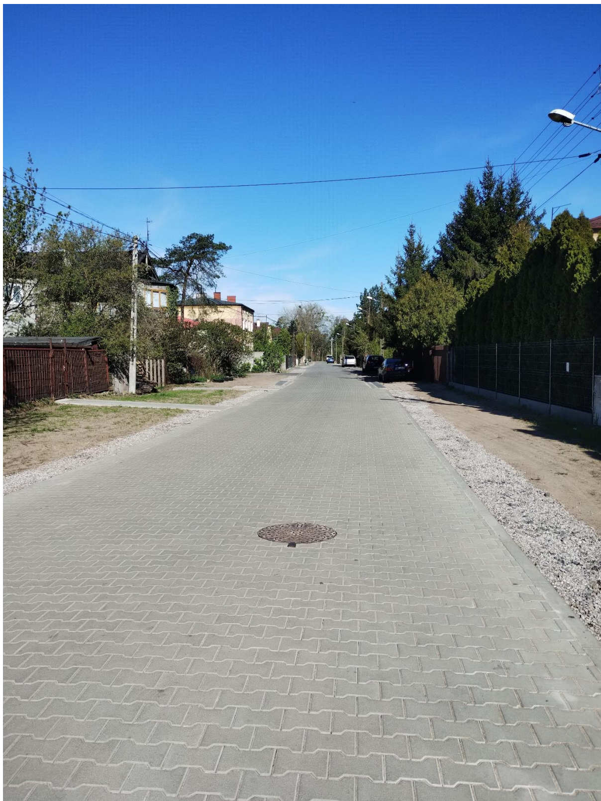
ul. Spacerowa po realizacji inwestycji