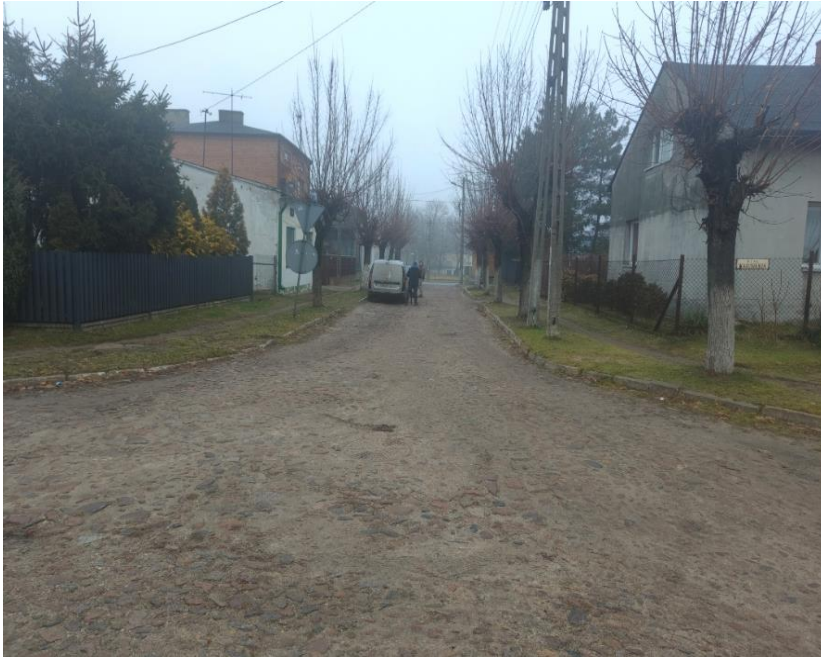
ul. Dolna przed realizacją zadania