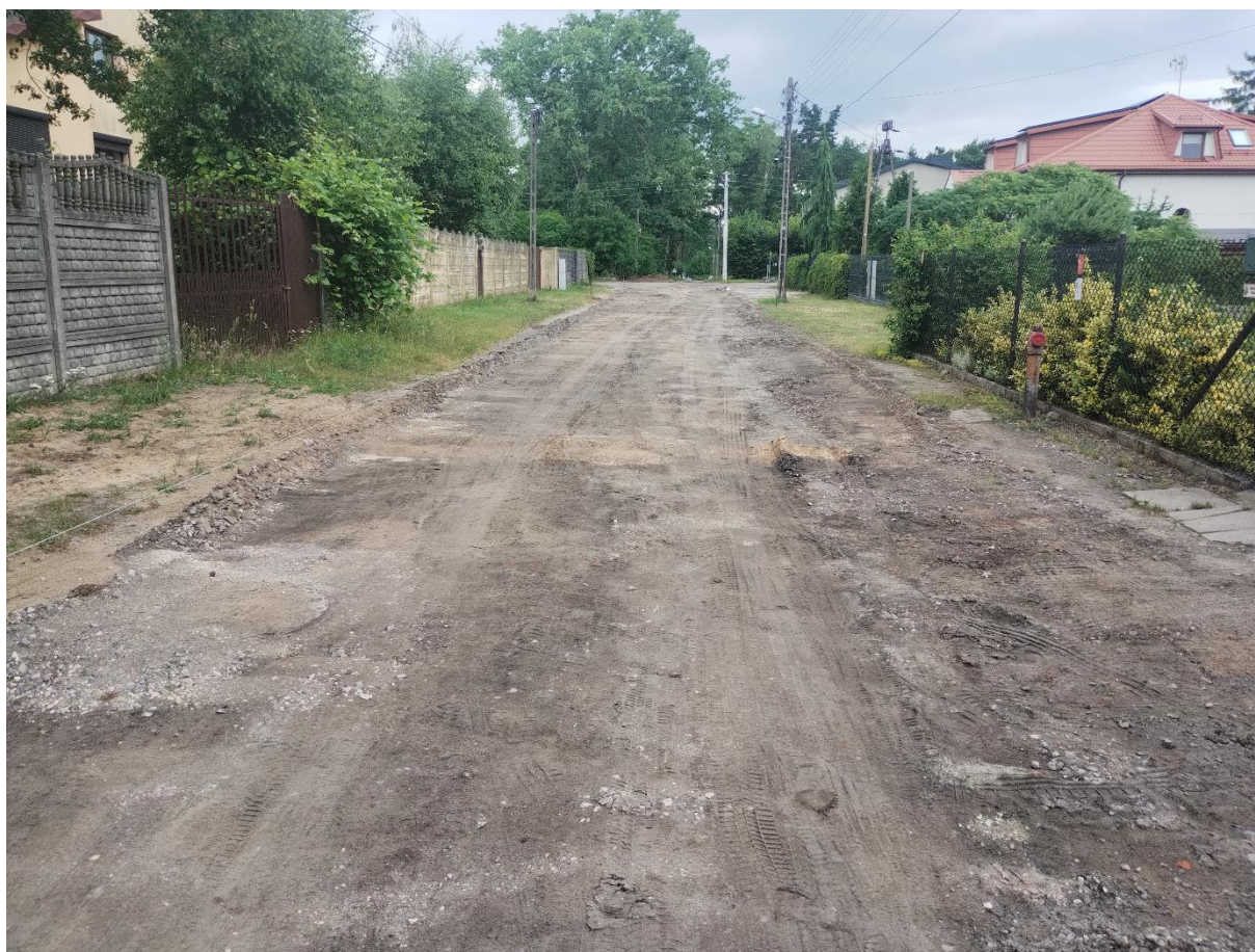
ul. Spacerowa przed realizacją zadania

Łączny koszt zadania w 2025 r. wraz z kosztem nadzoru inwestorskiego wyniósł 726 930,00 zł.