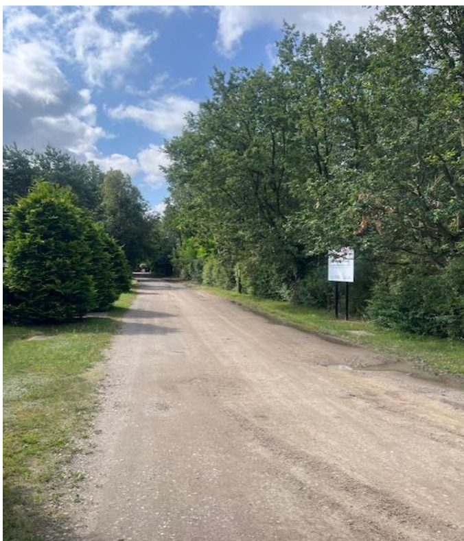
ul. Dębowa przed realizacją zadania